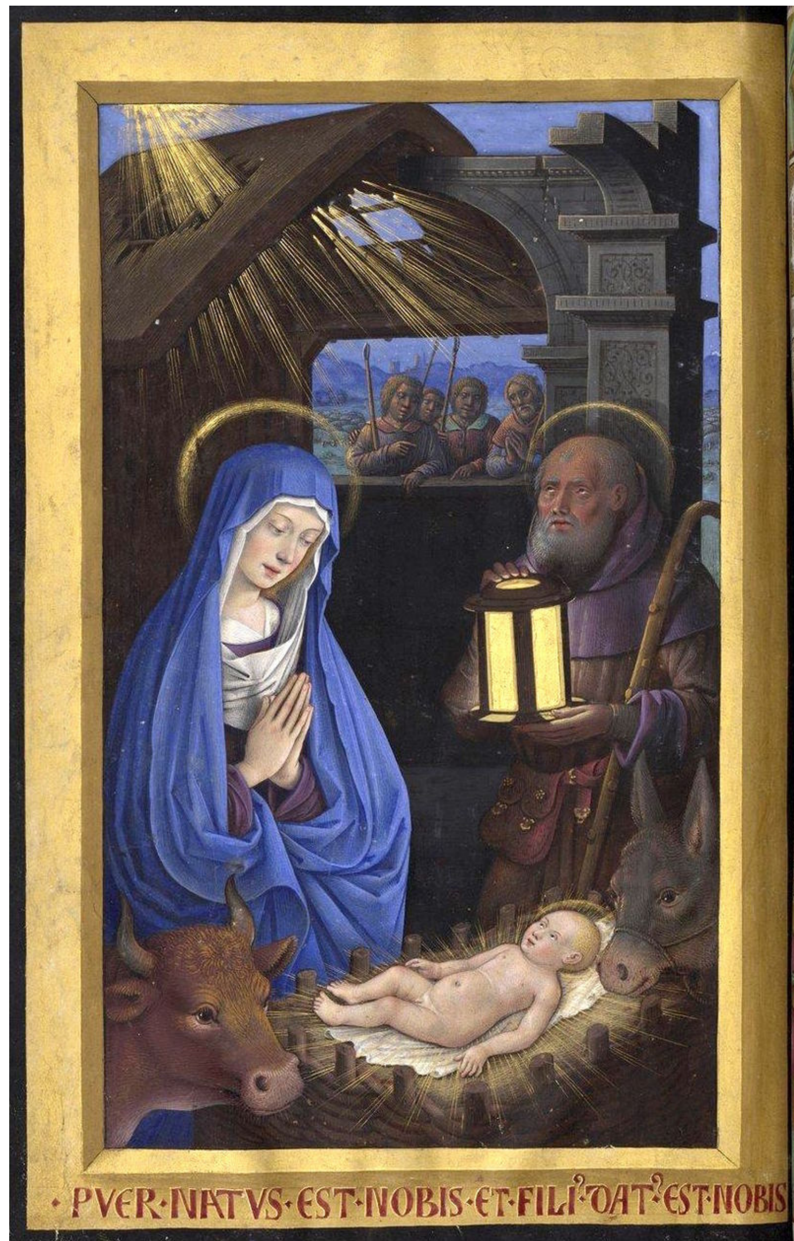
★ "La Nativité" Jean Bourdichon, Livre d'heures de Louis XII - XVe siècle.