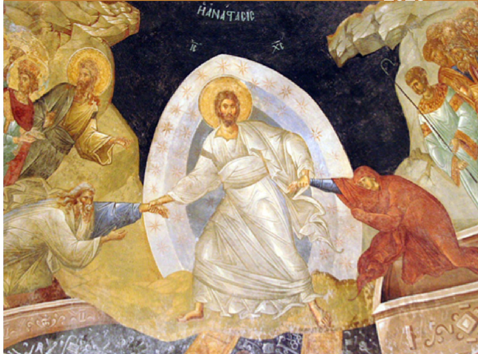
« Résurrection du Christ », 1315 -1321, Église Saint-Sauveur-in-Chora, à Istanbul.