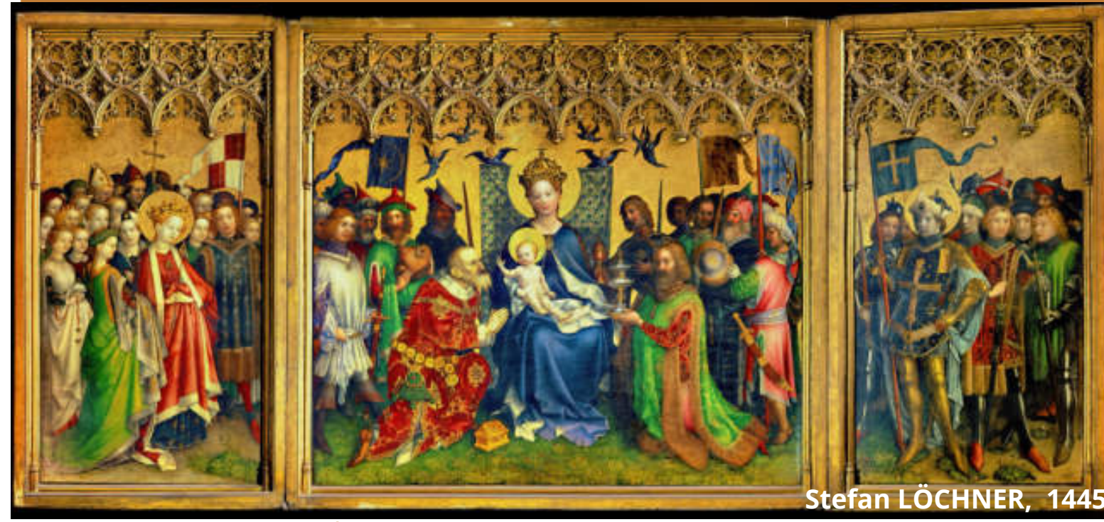
Stefan LÖCHNER, 1445