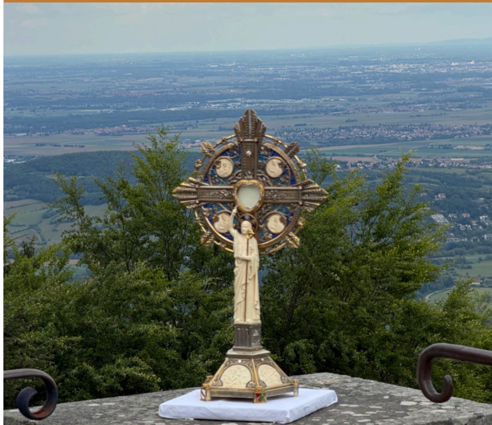
Saint Sacrement du Corps et du Sang du Christ Solennité