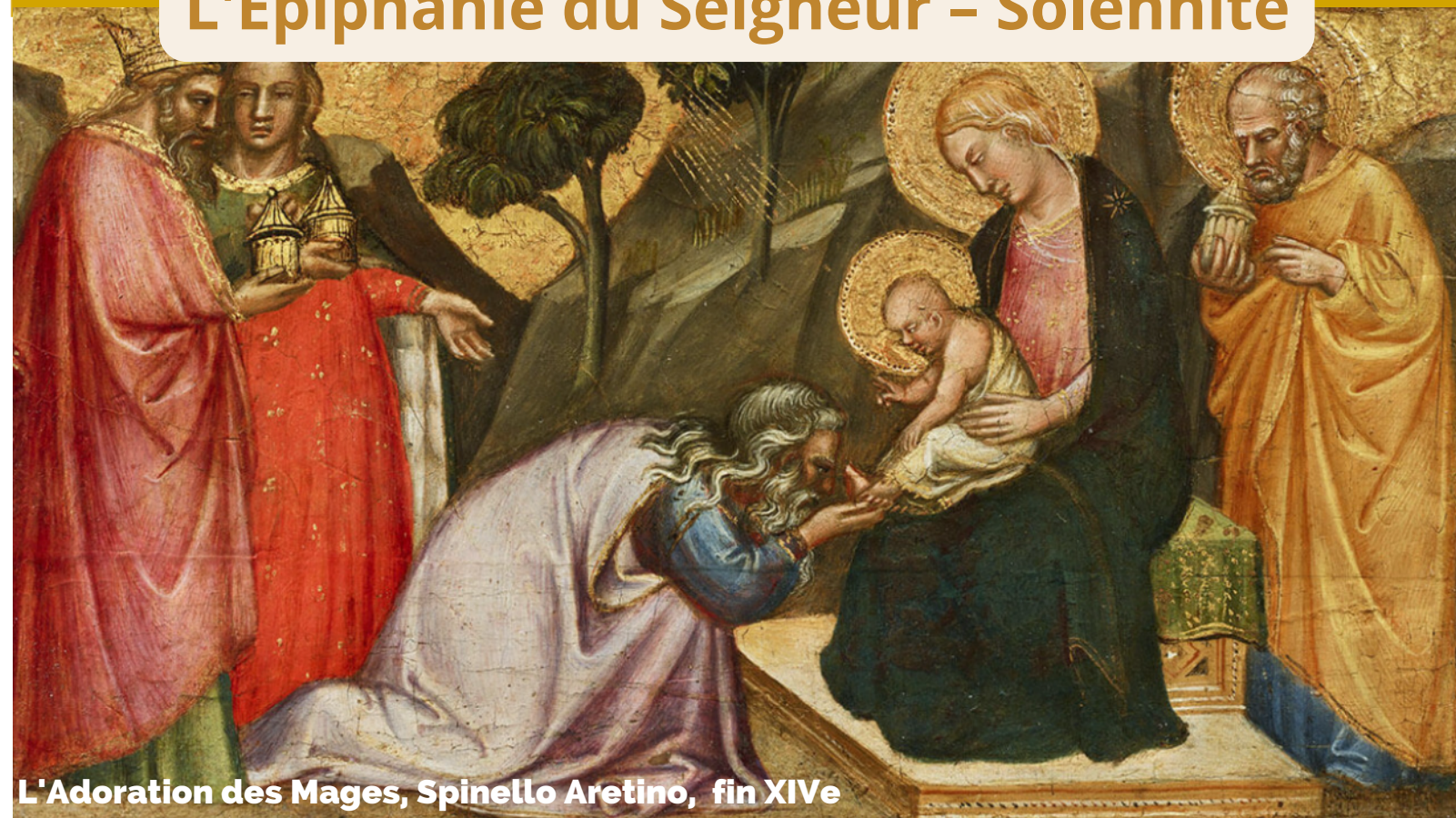
L'Adoration des Mages, Spinello Aretino, fin XIVe